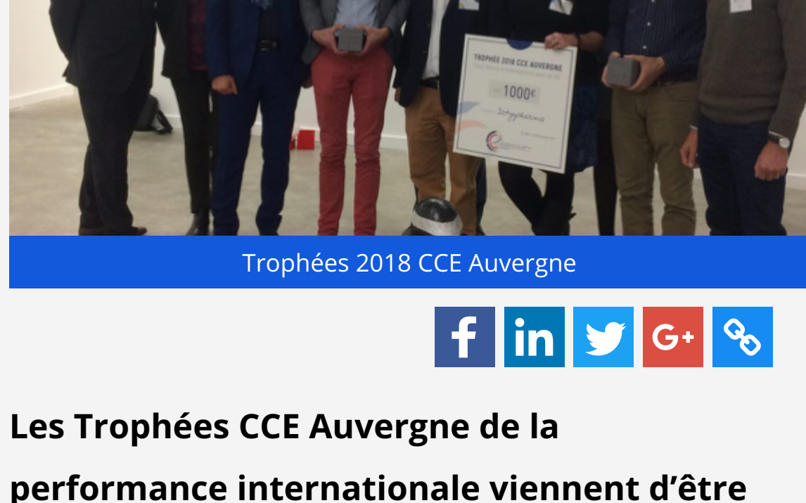
Trophées 2018 CCE Auvergne